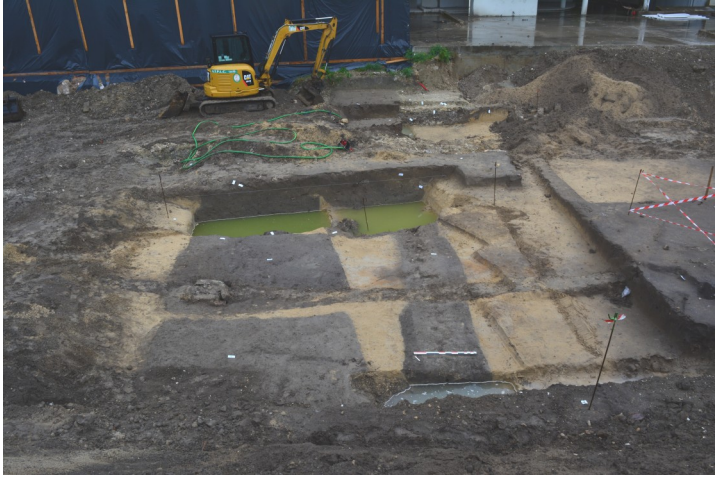
Fig.6 Vue des creusements médiévaux