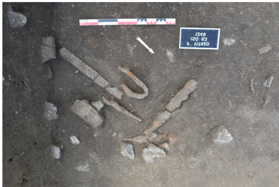
Fig.4 Objets en fer de La Tène, A. Bellido (Inrap)