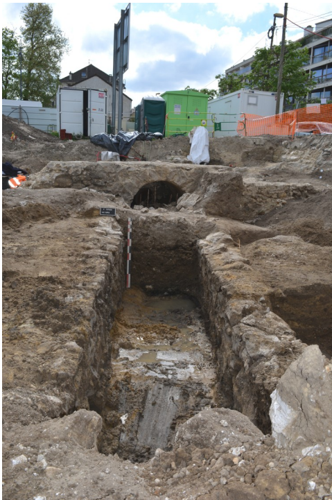
Fig.8 Egout maçonné du XIX e siècle