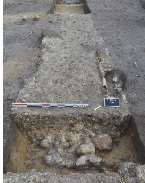
Fig.7 Tranchée et canalisation de l'Epoque Moderne