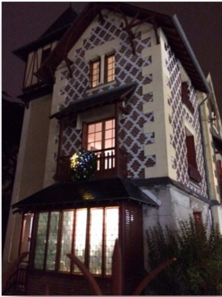
La Villa Max, illuminée pour l'occasion

Une nouvelle exposition d'aquarelles réussie pour Viviane GASSIER et ses élèves de Chel' Loisirs. Le Vendredi 6 décembre, jour du vernissage, la Villa Max avait sa tenue de fêtes avec les lumières au balcon et une grande effervescence dans les salles du rez-de-chaussée où les très nombreux tableaux y trouvaient bien leur place. En 4 jours, plus de 400 visiteurs ont pu apprécier les œuvres et échanger avec leurs créateurs. Un temps réussi à renouveler pour le plaisir de tous