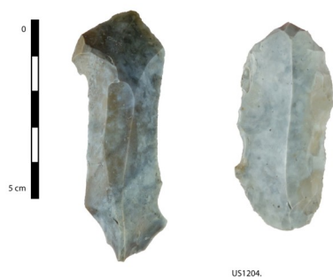
Fig.2 Eléments en silex du Néolithique, J. Durand (Inrap)