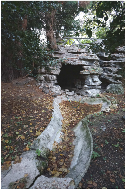
La fausse rivière, encombrée de feuilles, sera entièrement nettoyée