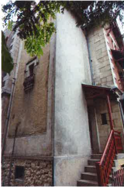
La façade ouest avant travaux, avec son triste enduit ciment

Cette année, le programme des travaux portait sur la restauration de la façade ouest de la tourelle d'escalier, malencontreusement revêtue d'un enduit ciment au cours du siècle dernier, sur le remplacement du garde-corps du balcon au dessus du bow-window, très dégradé par le temps, divers travaux au jardin, et quelques interventions de peinture au 1 er et au 2 nd étage. Les quelques vues qui suivent vous donneront un aperçu des résultats de cette campagne 2017.