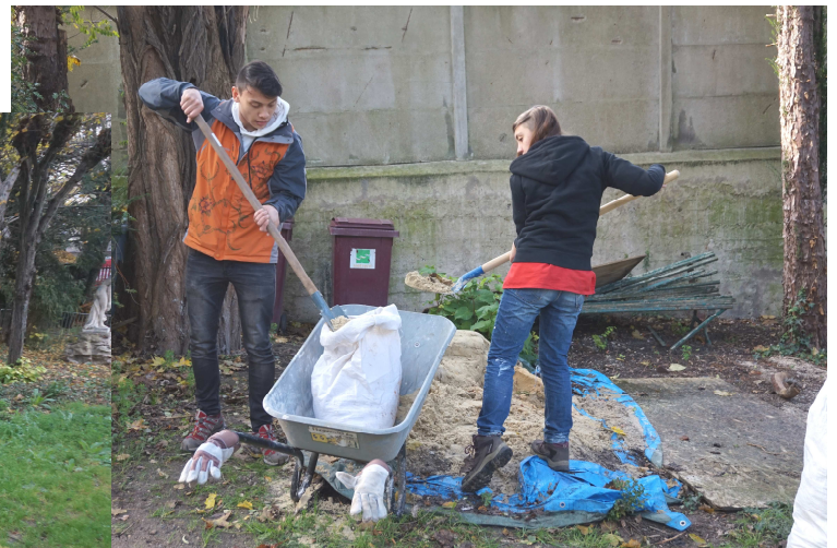
Qui retrouve maintenant une meilleure allure!