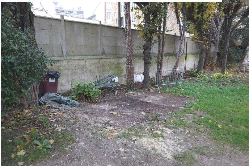
Attendons que l'herbe repousse. Autres travaux à suivre en janvier 2018. Merci à nos jeunes amis!!!