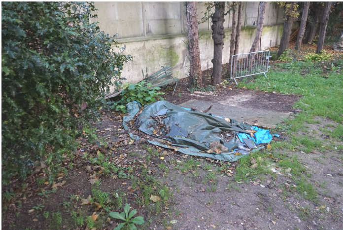
Le stock de sable sera mis en sac pour améliorer l'aspect du jardin