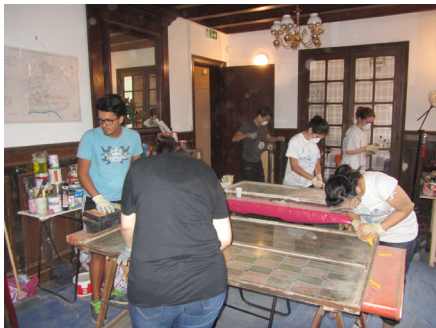
Tout le monde au travail

que vous serez nombreux à nous rejoindre pour ces deux événements désormais incontournables.