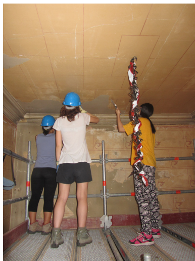
Décapage du plafond du hall depuis l'échafaudage