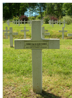
Sépulture d'Alain-Fournier, Saint-Remy-la-Calonne (55)