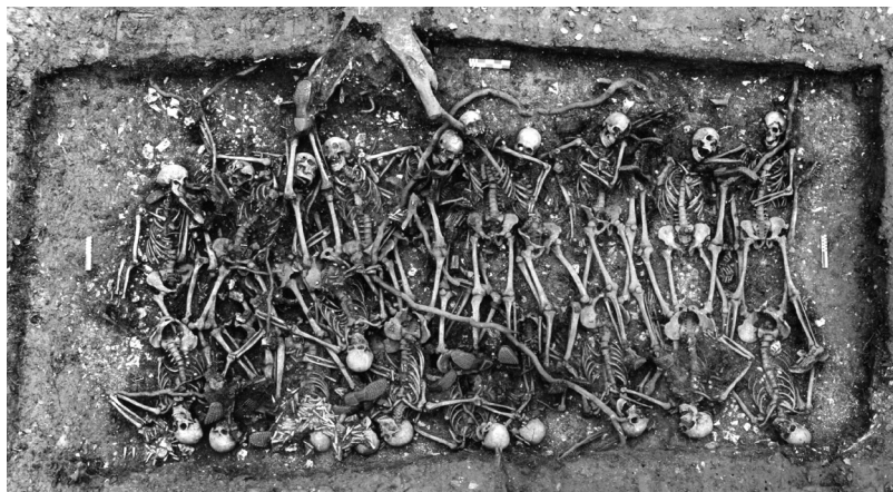
Sépulture multiple de Saint-Remy-la-Calonne (55). Soldats portés disparus le 22 septembre 1914

par Frédéric ADAM, archéo-anthropologue, chargé de recherche Inrap Grand-Est, UMR 7268 ADES