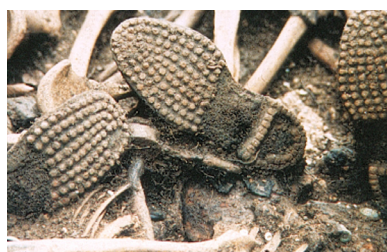
Brodequins français en cours de fouille

La conférence se proposera de faire découvrir ce nouveau champ d'investigation archéologique et ses apports à la connaissance et l'identification des soldats disparus sur les champs de batailles de la Première Guerre mondiale.