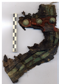
Galons et boutons de manche d'un lieutenant porté disparu le 25 août 1914, Boinville-en-Woëvre (55)