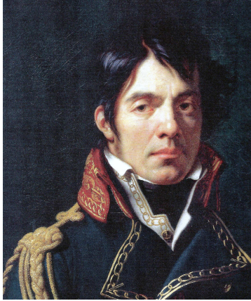
Le baron Dominique Larrey