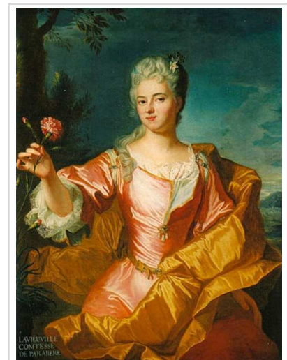
Madame de PARABÈRE