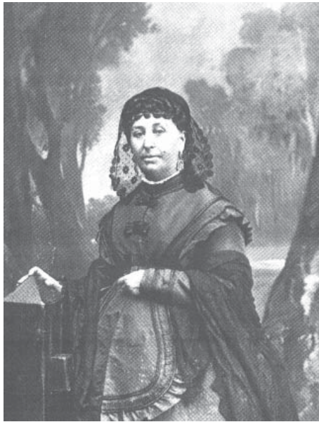
G. Sand photographiée par Nadar en 1869