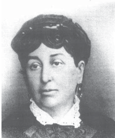
G.Sand en 1877

Républicaine en 1848, mais condamnant les violences de la Commune en 1871, George posera dans ses romans des questions sociales sur la propriété, le rapport du capital et du travail... Elle sera liée à de nombreux républicains, comme LEROUX, BARBES, Louis BLANC, LAMMENAIS ... Elle luttera toute sa vie pour une égalité à la fois civile dans le mariage des femmes et défendra le droit au divorce, la fin des poursuites pour adultère, une instruction égale des hommes et des femmes, l'égalité des femmes au sein de la famille.