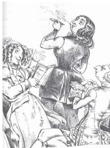
Caricature de Georges Sand