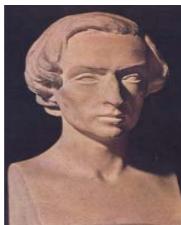
Buste de F. Chopin par Dantan